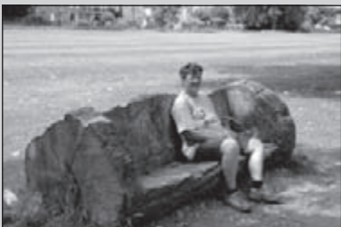
Dwars door Londen

Wandelen op de Ardense hoogten. Met de OLAT Clubreis ben je er helemaal uit.